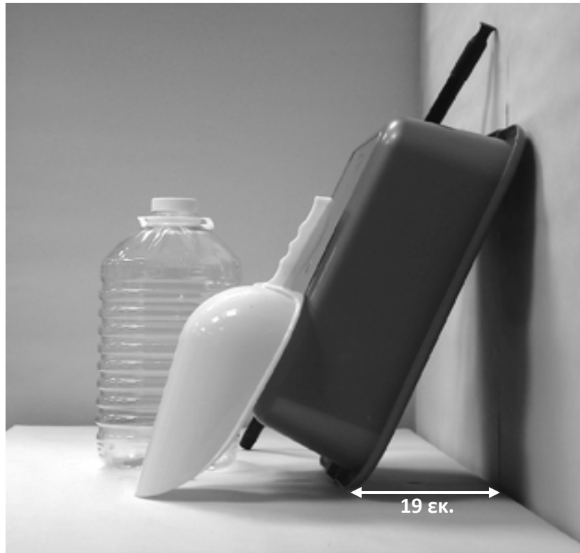
τρίτη φωτογραφία: πλάγια όψη