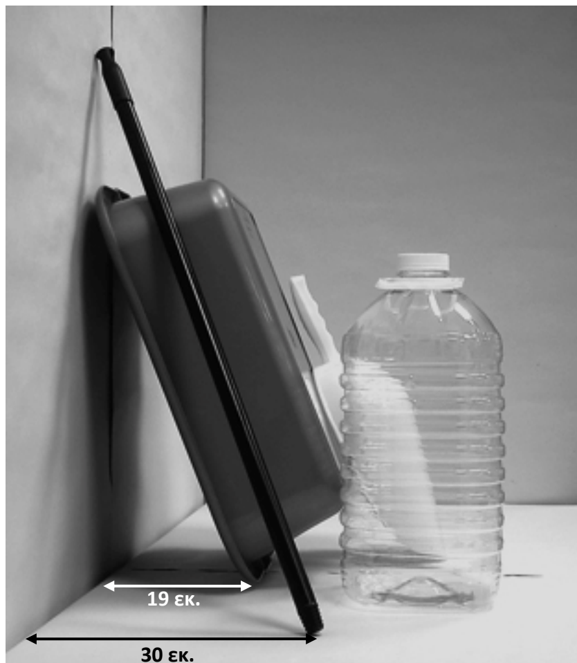
τέταρτη φωτογραφία: πλάγια όψη